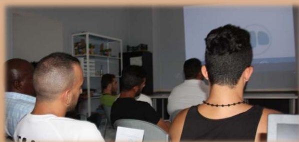
Centros de acogida y atención

Cinefórum Solidario Cinefórum Consciente Jornadas de Actualización Talleres Solidari@s Informa TB Ciclo Interactivi@s