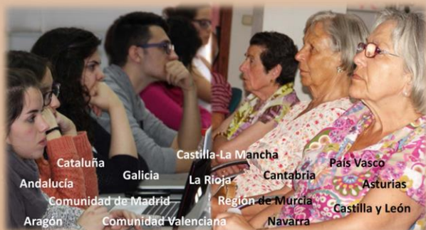
Centros de atención sanitaria

Cinefórum Solidario Cinefórum Consciente Jornadas de Actualización Talleres Solidari@s Informa TB Ciclo Interactivi@s